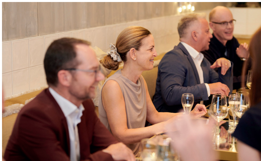
Diplomfeier vom AKAD-Lehrgang Verwaltungsrätin/Verwaltungsrat SAQ-Zertifikat im Mai 2023

Zirka 99% der Unternehmen in der Schweiz sind KMU, per Definition zwischen 1 und 249 Mitarbeitenden. Kleinere und mittlere Unternehmen sind somit zentral für die Schweizer Wirtschaft. Ihre Wettbewerbsfähigkeit basiert auf einer guten Strategie, hoher Qualität, Innovationskraft und Flexibilität.